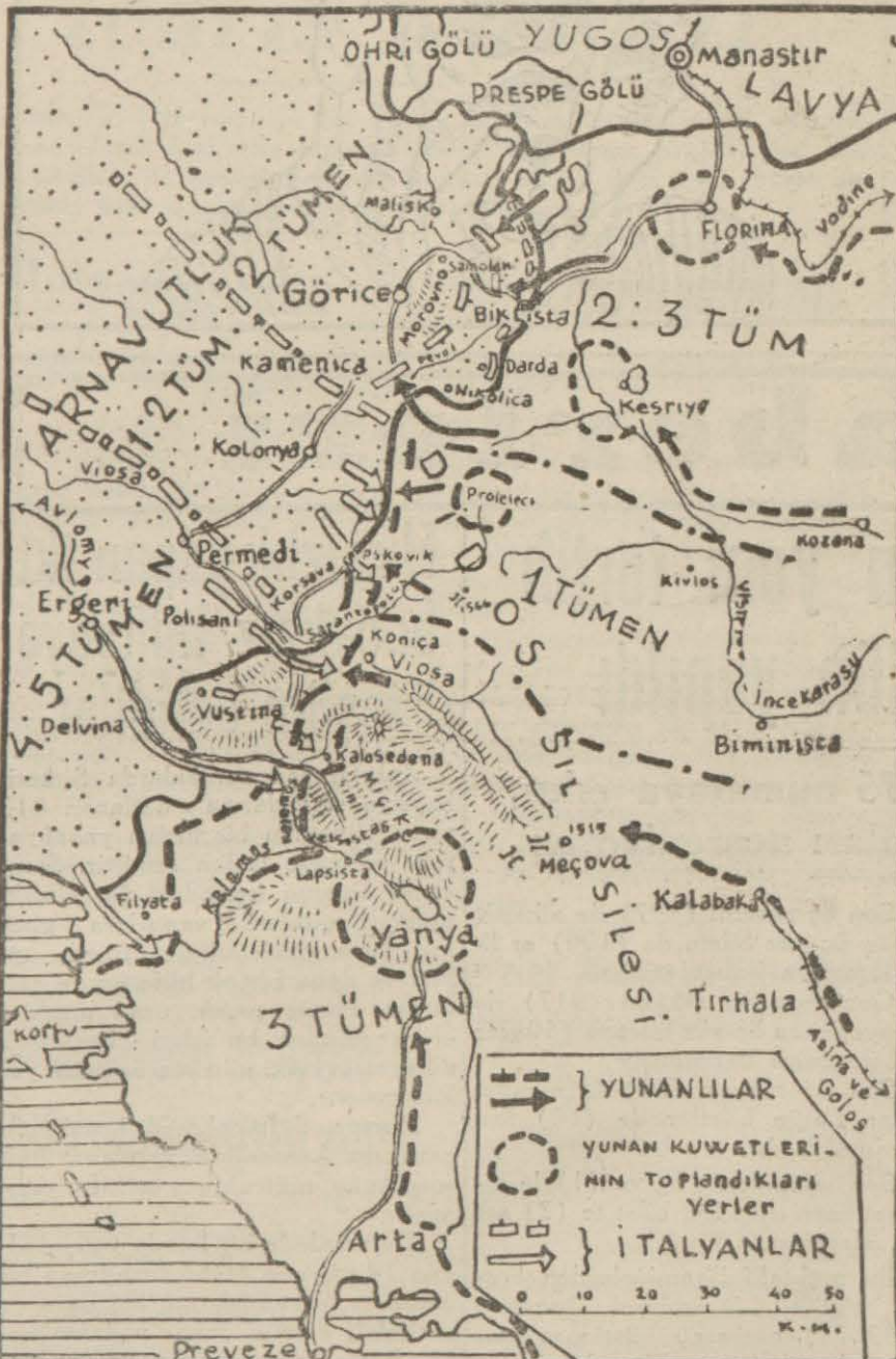
Yunan - İtalyan cephesinde vaziyeti gösterir kroki