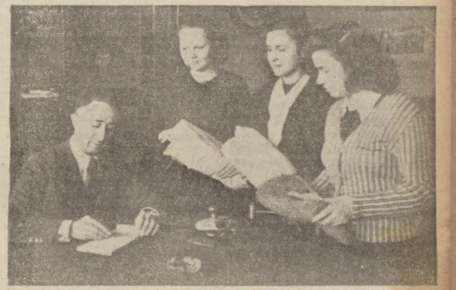
Halkevlerine askerlerimizin için ördükleri çorap, eldiven ve süveterleri getiren genç kızlar

Partide bir toplantı yapıldı, bir de komisyon teşkil edildi